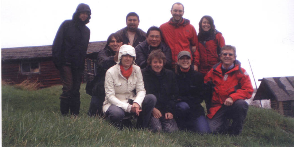
LES ARCHITECTES DE L'URGENCE ET LES MEMBRES DU CONSEIL DE KITCISAKIK